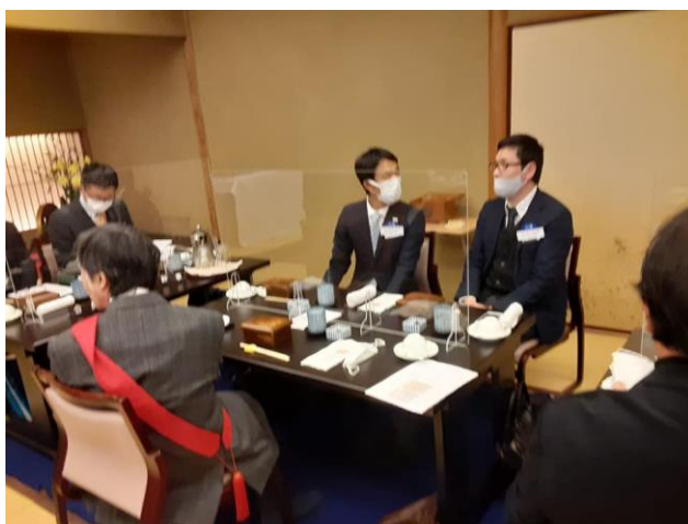
第 3G 合同プロジェクト医療機関マスク等物資 寄贈についてのご報告 藤沢市よりの感謝状です。