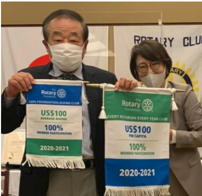
米山奨学会より 永松会員、高科会員、芝会員、表彰されました